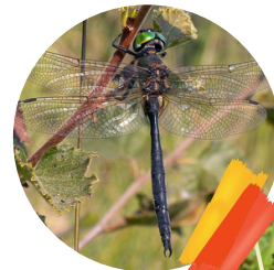
La Cordulie arctique

Les autres espèces du genre Somatochlora .