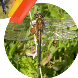
La Cordulie métallique