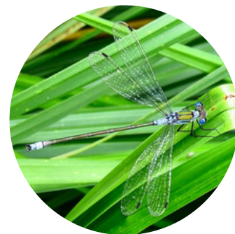
Le Leste des bois

Le Leste des bois : notamment pour les femelles dont la détermination à vue en main nécessite une loupe de terrain et reste délicate.