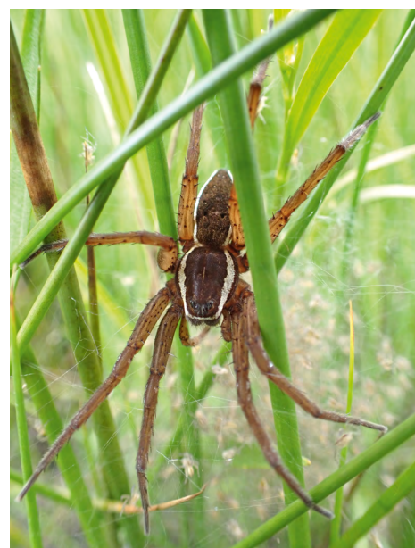
■ La Dolomède des roseaux ( Dolomedes plantarius ), classée "En danger"