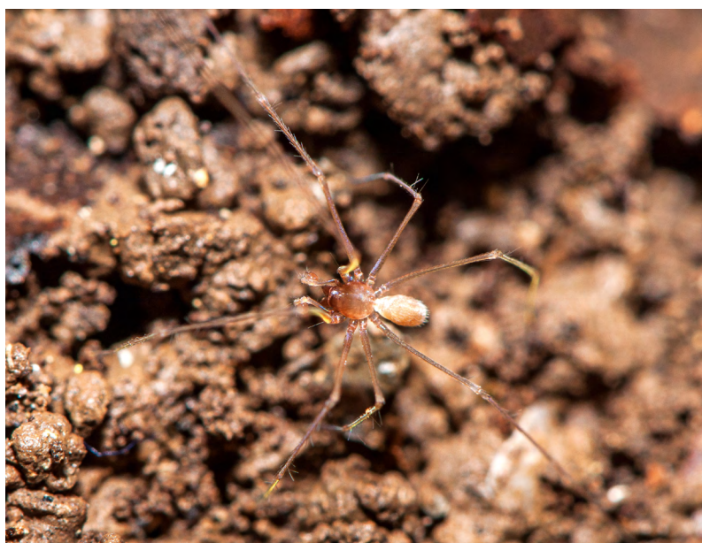
■ Leptoneta microphthalmma , une araignée cavernicole endémique des Pyrénées, "Quasi menacée"

(δ) X : espèce endémique de France métropolitaine.