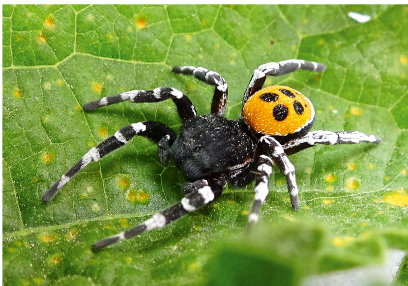
■ L'Érèse sandalion ( Eresus sandaliatus ), classée "Quasi menacée", présente un fort dimorphisme sexuel, la femelle (en haut) et le mâle (en bas) ayant des apparences très différentes