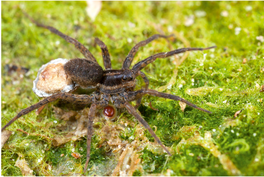
■ La Pardose des prés salés ( Pardosa purbeckensis ), classée en catégorie "En danger"