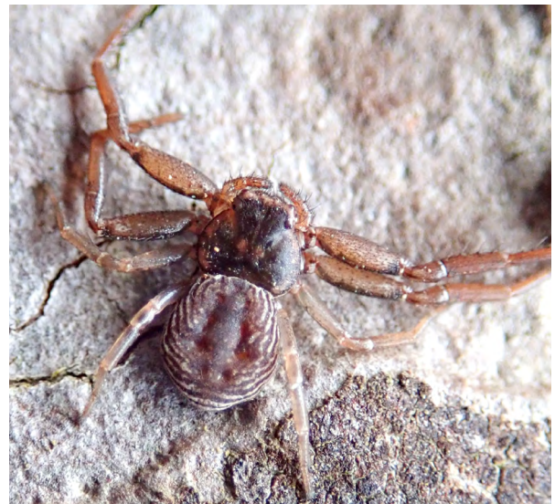
■ Le Thomise frippé ( Coriarachne depressa ), une araignée "En danger" vivant sur et sous l'écorce des résineux de forêts anciennes