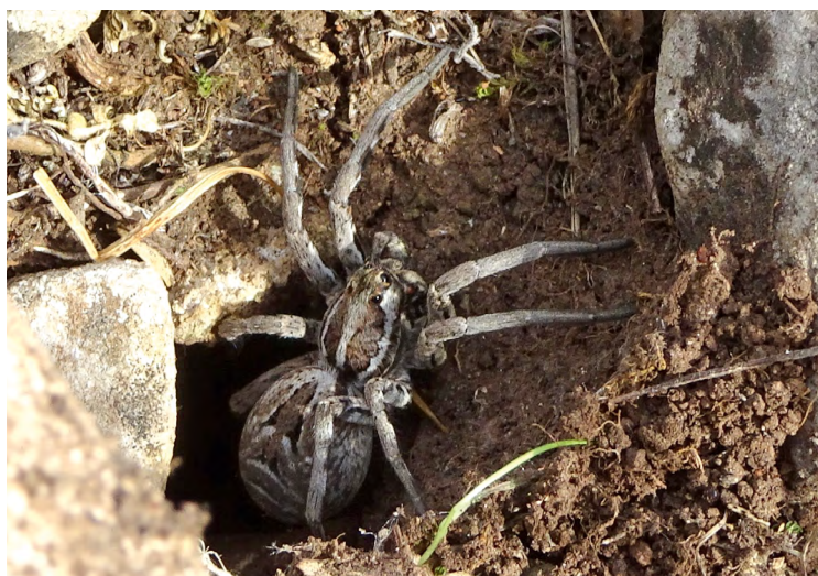
■ La Lycose de Narbonne ( Lycosa tarantula ), une espèce des pelouses sèches steppiques classée en "Préoccupation mineure" mais subissant un déclin

(δ) X : sous-espèce endémique de France métropolitaine.