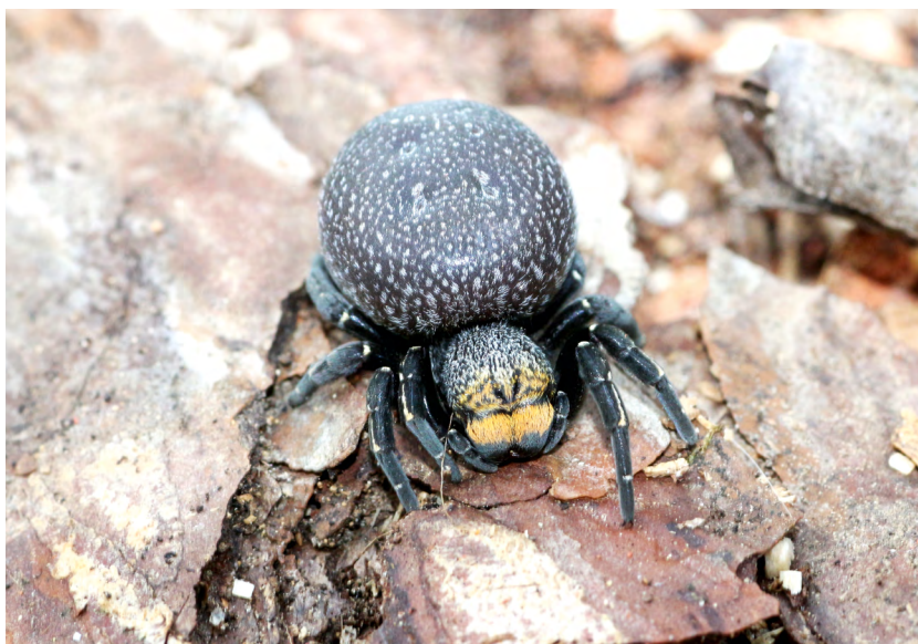
■ Érèse sandalion femelle © Anne Bounias-Delacour