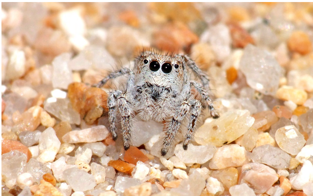
■ Le Mogrus des plages ( Pseudomogrus salsicola ), une araignée "Vulnérable"