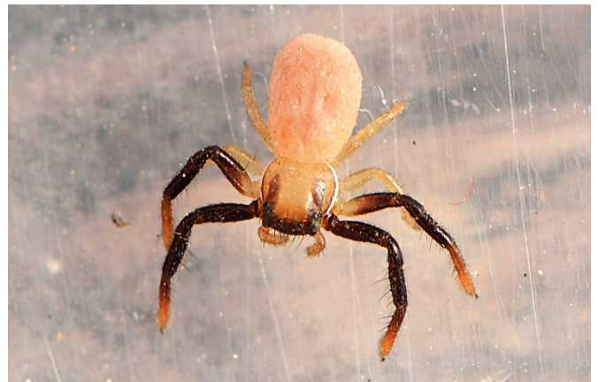
■ Le Firmicus à deux bandes ( Firmicus bivittatus ), appartenant à la famille des araignées-crabes, est une espèce rare et discrète des prairies écorchées méditerranéennes, classée en catégorie "Données insuffisantes" en raison du manque d'informations sur sa répartition

Au final, l'état des lieux a porté sur 1 622 espèces d'araignées. Le bilan synthétique est présenté en page suivante et les résultats détaillés p. 11 à 18.