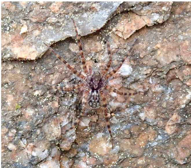
■ La Petite Lycose des Sudètes ( Acantholycosa norvegica ), classée "En danger critique", habite les éboulis froids et les grottes glacées, se fondant dans son environnement par son apparence cryptique

L'évaluation a été menée par le Comité français de l'UICN et PatriNat (OFB-MNHN-CNRS-IRD), en collaboration avec l'Association Française d'Arachnologie (AsFrA). Elle a bénéficié de la contribution d'auddicé et du GON pour la coordination de la phase préparatoire, et du soutien de l'UMR TREE (Université de Pau - CNRS) pour la cartographie et les statistiques. Elle a mobilisé les connaissances de spécialistes pendant près de trois ans, qui ont apporté leur expertise pour la compilation et la vérification des données, ainsi que pour l'établissement des analyses préliminaires. Douze d'entre eux ont ensuite participé à la validation collégiale des résultats lors d'un atelier organisé sur sept jours en mars 2022. Une catégorie a alors été attribuée à chaque espèce selon la méthodologie de l'UICN. Les résultats ont ensuite été consolidés conformément au référentiel taxonomique national TaxRef.