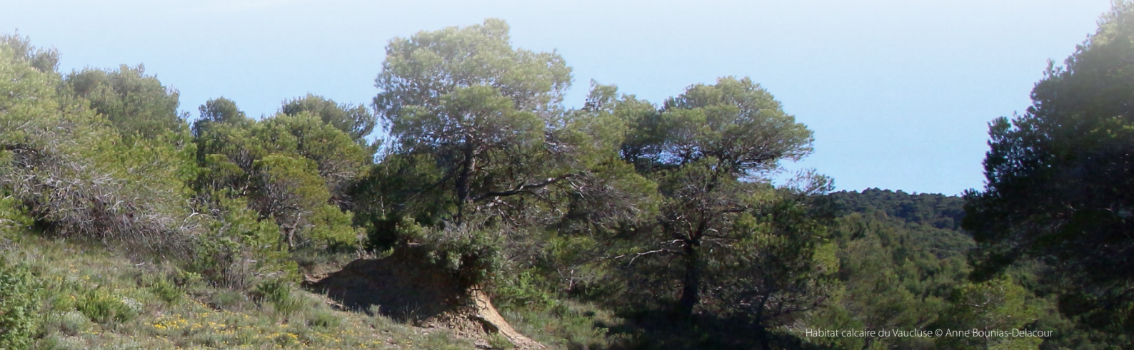
Habitat calcaire du Vaucluse

Malgré les menaces qui pèsent sur les araignées, aucune espèce ne fait à ce jour l'objet d'un programme de conservation dédié ou de mesures de protection spécifiques. Les résultats de la Liste rouge contribueront à orienter les stratégies d'acquisition de connaissance et les priorités d'action pour sauvegarder la diversité de ces espèces. L'état des lieux souligne l'importance de la préservation des habitats naturels pour assurer la conservation de cette faune exceptionnelle.