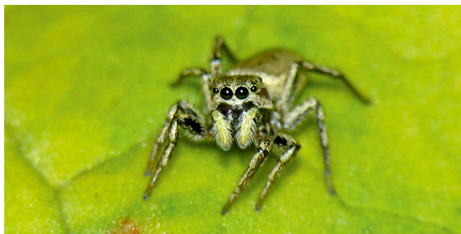
■ Heliophanus patagiatus , espèce des berges à galets classée "Quasi menacée"

Le changement climatique constitue une menace croissante qui modifie les conditions de l'environnement et altère la qualité de l'habitat des espèces. Les araignées montagnardes sont particulièrement concernées en raison de la hausse des températures, qui contraint les populations à monter en altitude afin de conserver des conditions de vie correspondant à leurs exigences écologiques. Cela concerne par exemple la Coelotes catalane , classée "Vulnérable". Les déplacements imposés par le réchauffement peuvent toutefois être entravés par la dégradation des milieux ou s'avérer impossibles en l'absence d'autres habitats favorables.