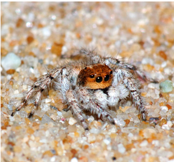
■ L'Asianelle de Bosmans ( Aelurillus bosmans ), trouvée dans les milieux sableux et maquis rocheux corses, classée "Vulnérable"